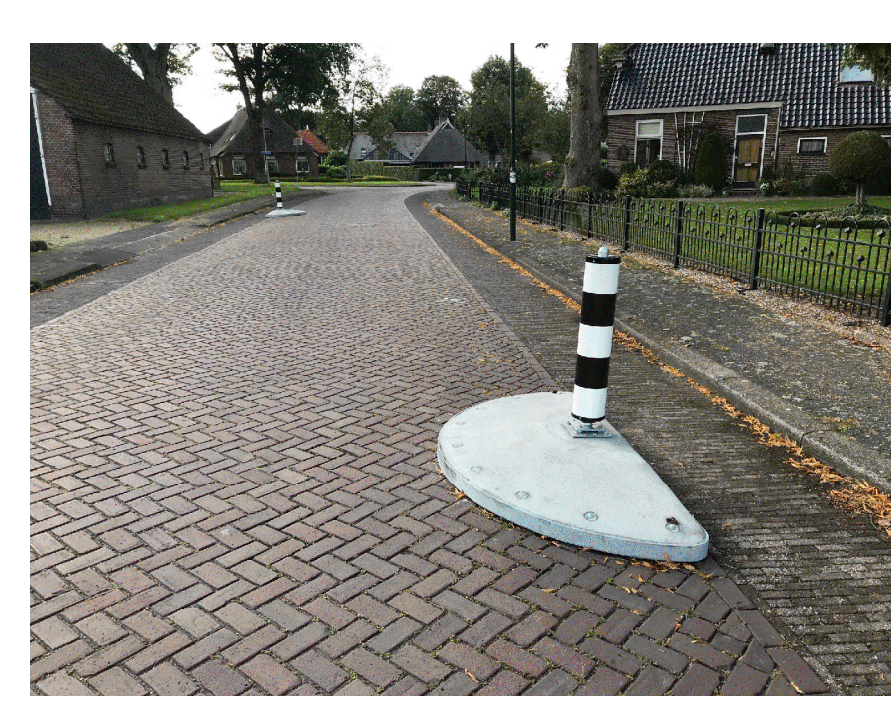
Voorbeeld toepassing straatjuweel van Leicon