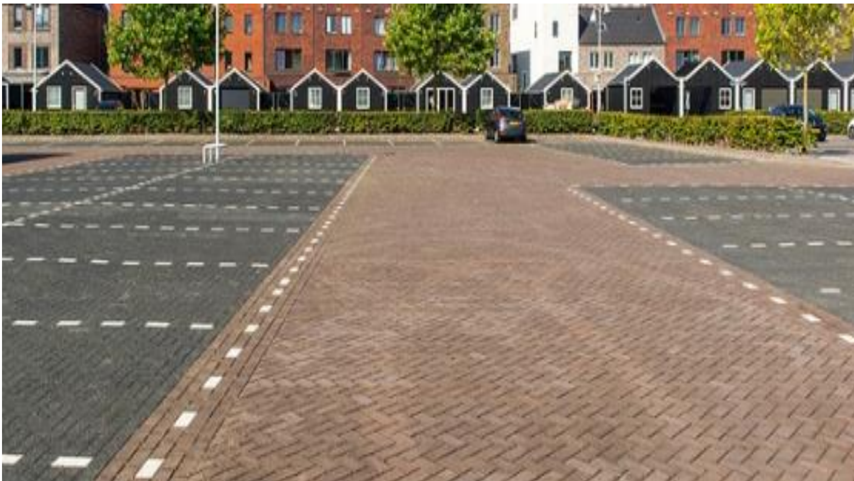
Gebakken straatbakstenen Kleur: Marrone