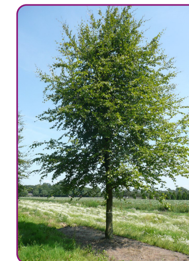
Fagus sylvatica - beuk Bloei: onopvallend - geel Herfstkleur: oranje, bruin Hoogte: 25-30m