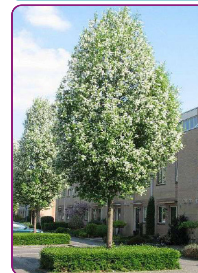
Prunus padus 'Albertii' - gewone vogelkers Bloei: wit Herfstkleur: geeloranje, rood Hoogte: 8-10m