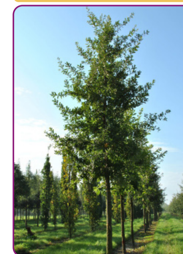
Quercus x hispanica 'Wageningen' - Spaanse eik Bloei: geel Herfstkleur: - Hoogte: 8-12m