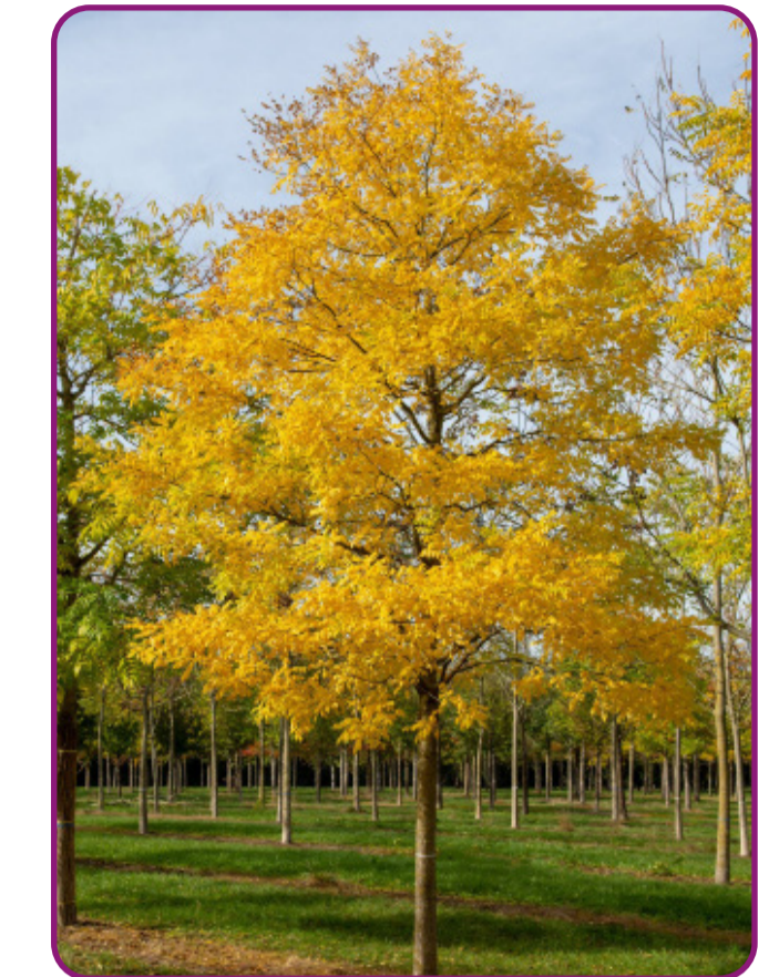
Styphnolobium japonicum 'Regent' - honingboom Bloei: wit Herfstkleur: geel Hoogte 12-15m