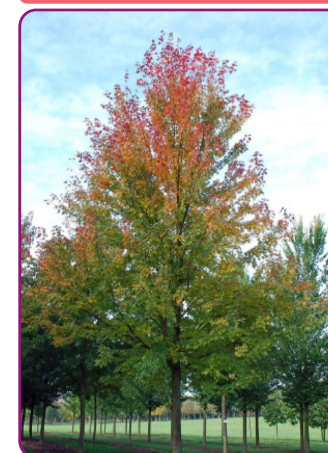
Acer x freemanii 'Celzam' - esdoorn Bloei: onopvallend - rood Herfstkleur: geel, rood Hoogte: 10-15m