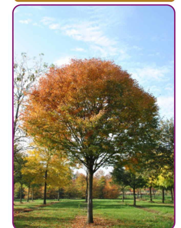
Zelkova serrata - Japanse schijniep Bloei: onopvallend - groen Herfstkleur: oranjerood Hoogte: 10-12m