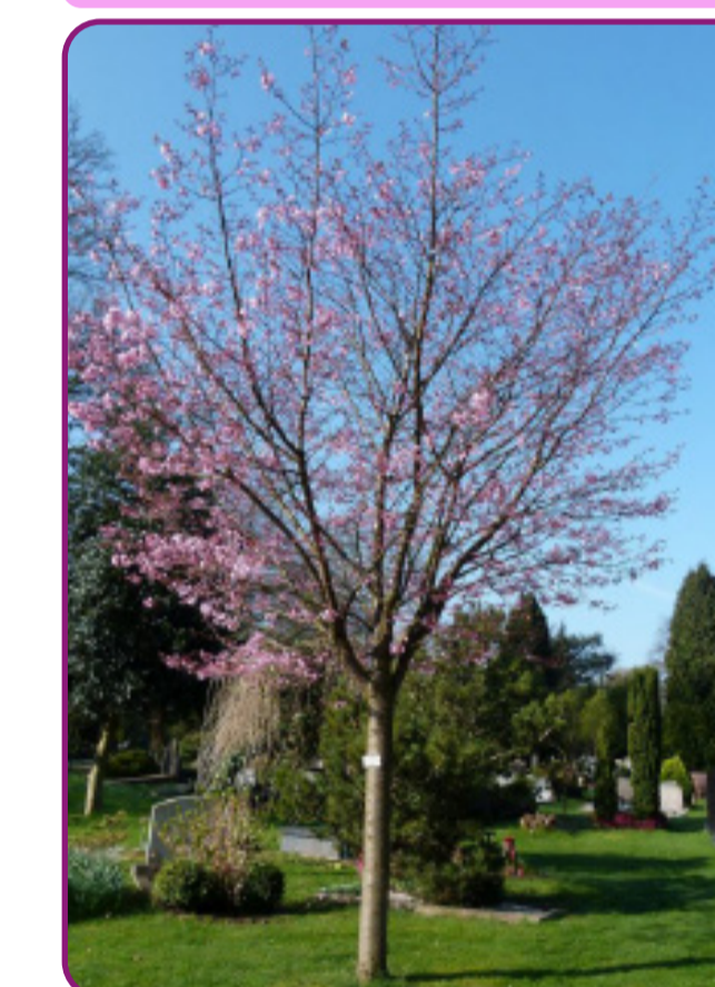
Prunus sargentii 'Charles Sargent' - sierkers Bloei: roze Herfstkleur: Oranjerood Hoogte: 8-10m