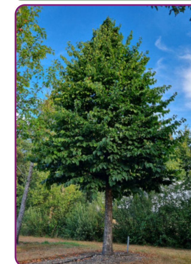
Corylus colurna - boomhazelaar Bloei: geelbruin Herfstkleur: geel Hoogte: 15-20m