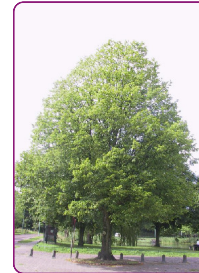
Tilia platyphyllos 'Naarden' - zomerlinde Bloei: geel Herfstkleur: geel Hoogte: 15-20m