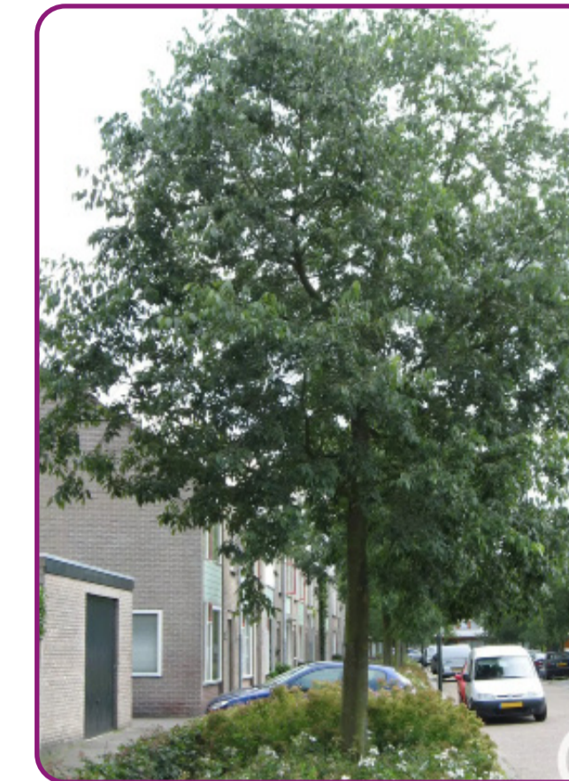
Celtis australis - Europese netelboom Bloei: onopvallend - witgroen Herfstkleur: geel Hoogte: 15-20m