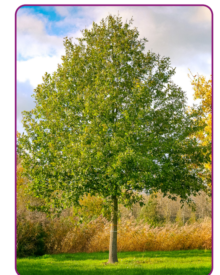
Quercus robur - eik Bloei: onopvallend - geel Herfstkleur: geel, bruin Hoogte: 25-35m