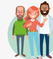
Aansluitfunctionaris bij kinderopvang en scholen