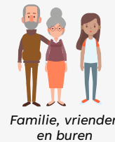
Familie, vrienden en buren