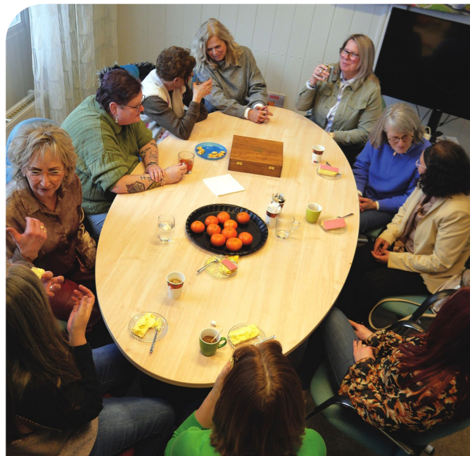
Quiet bouwt aan netwerk voor mensen die het nodig hebben.

Wij willen er graag voor heel Maashorst zijn!