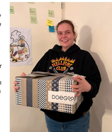
Kim krijgt elke maand een levensmiddelenpakket.

Meer informatie: gertie.theunissen@zorgcooperatie-reek.nl